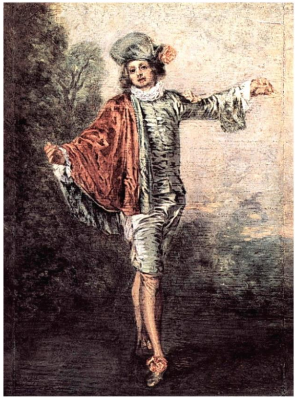
Луи́ Дюпрé 1697 -1774

Артист, первым объединивший две манеры исполнения – французскую и итальянскую, один из основоположников мужского сценического танца. Превосходный танцовщик, член Королевской академии танца и музыки, педагог и балетмейстер.