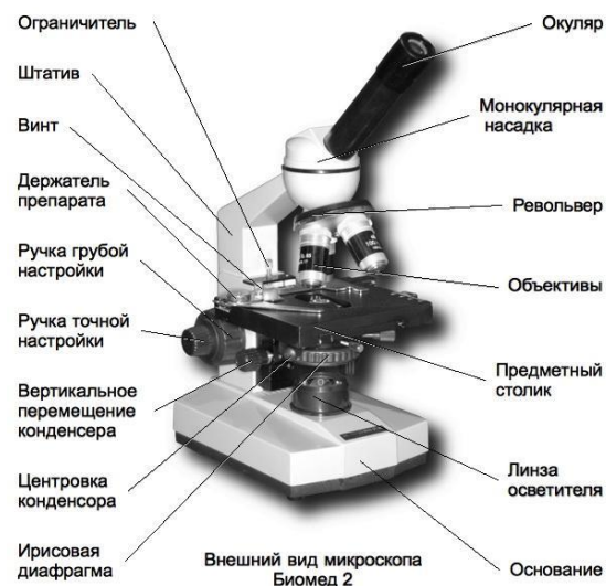
Внешний вид микроскопов Биомед 1 и Биомед 2

Объектив – одна из важнейших частей микроскопа, поскольку он определяет полезное увеличение объекта . Объектив состоит из металлического цилиндра с вмонтированными в него линзами, число которых может быть различным. Увеличение объектива обозначено на нем цифрами. В учебных целях используют обычно объективы \times 8 и \times 40 . Качество объектива определяет его разрешающая способность.